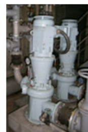
しさを移送ポンプ