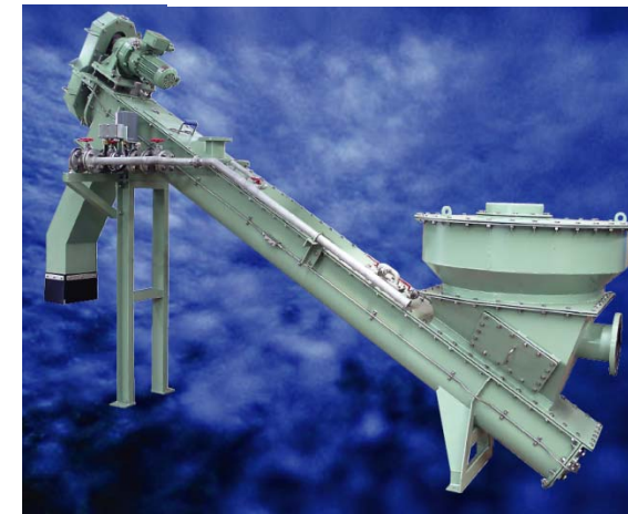
図2 エスカルゴ外形